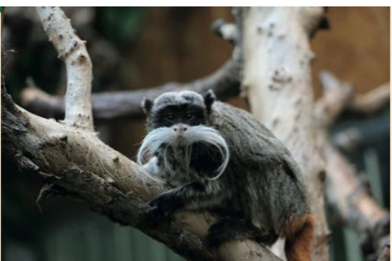
Le tamarin empereur